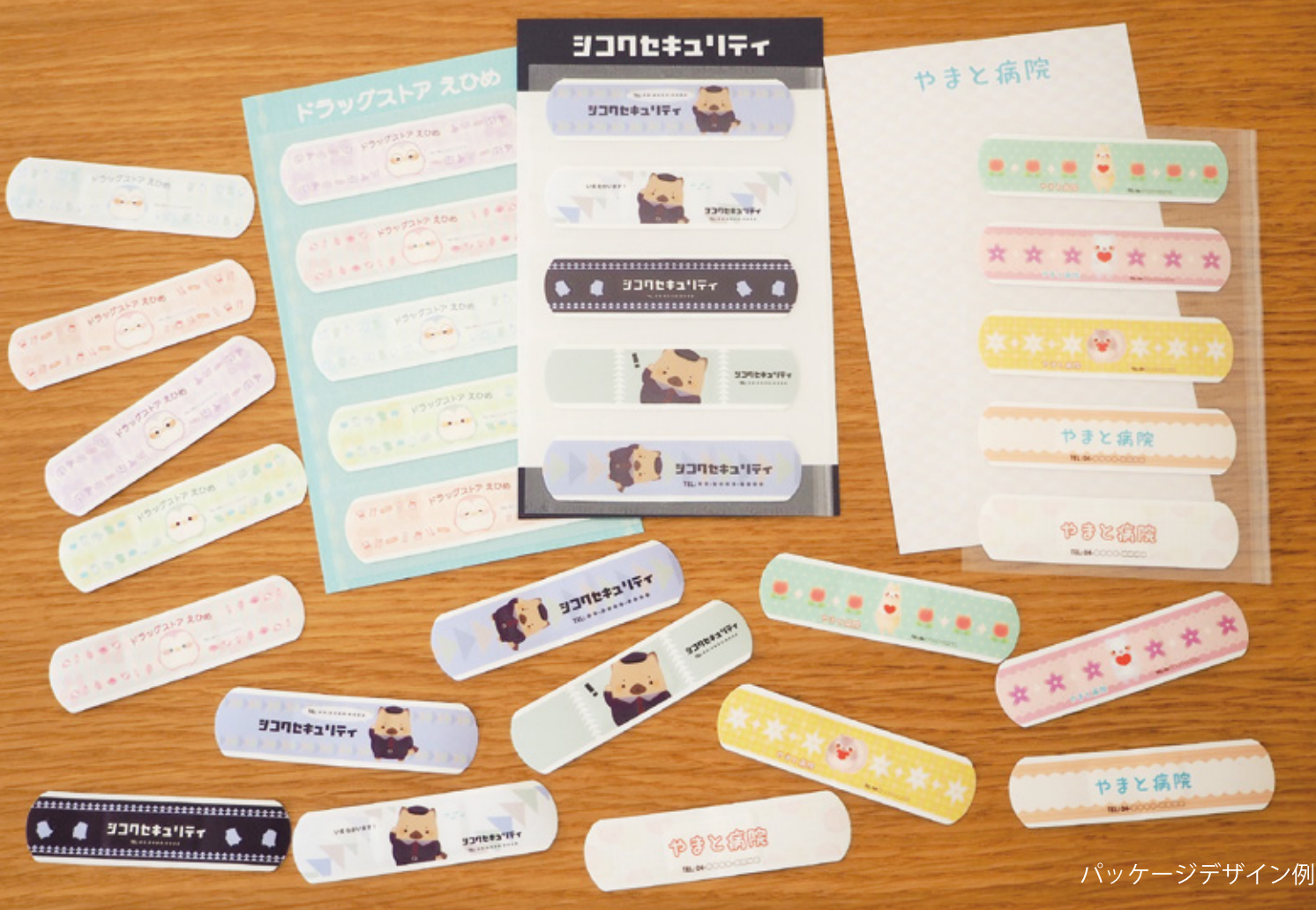
パッケージデザイン例