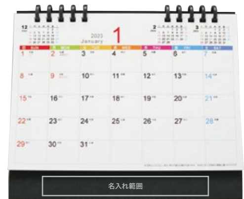
サイズ: W130×H15 mm