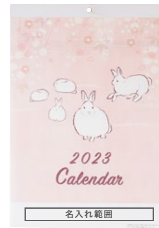
サイズ: W260×H25 mm