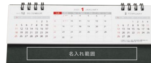
サイズ: W130×H15 mm