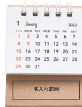
サイズ: W55×H15 mm