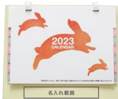
サイズ: W100×H15 mm