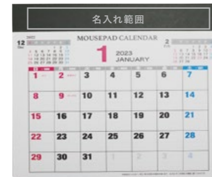
サイズ: W130×H15 mm