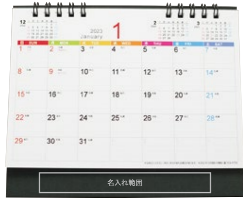
サイズ: W130×H15 mm