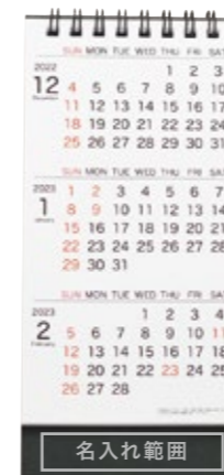
サイズ: W75×H15 mm

3ヶ月分のカレンダーを1度に確認できるので、 スケジュールをたてる際にとっても便利です。