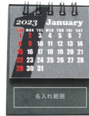
サイズ: W55×H15 mm