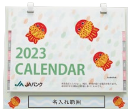
サイズ: W100×H15 mm