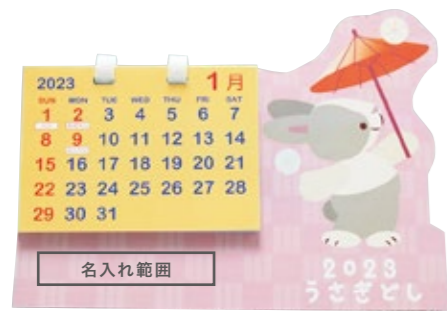
サイズ: W55×H10 mm