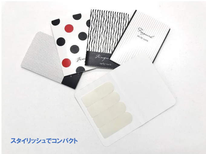
スタイリッシュでコンパクト