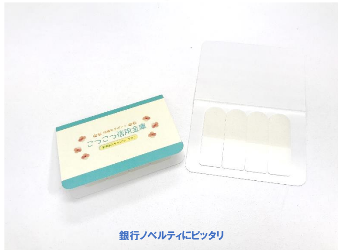
銀行ノベルティにピッタリ