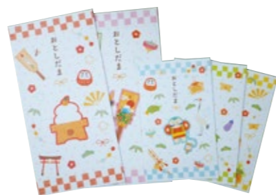
大 2 枚 小 3 枚セット 粗品ラベル入り