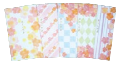
小 5 枚セット