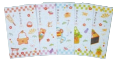
小 5 枚セット