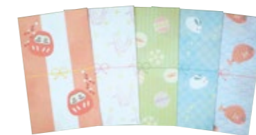
小 5 枚セット