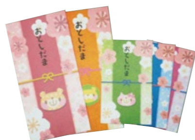
大 2 枚 小 3 枚セット 粗品ラベル入り