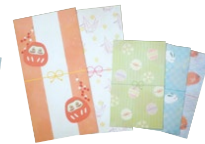
大 2 枚 小 3 枚セット 粗品ラベル入り