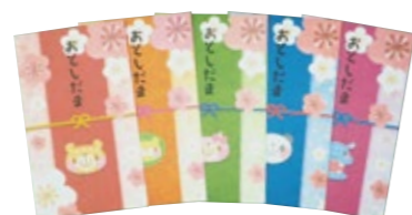
小 5 枚セット