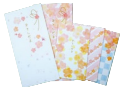
大 2 枚 小 3 枚セット 粗品ラベル入り