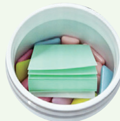
ボトルガムの捨て紙としても 使われている水性糊