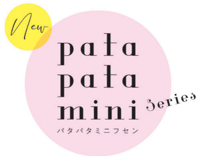
ブック型ミニフセンシリーズ