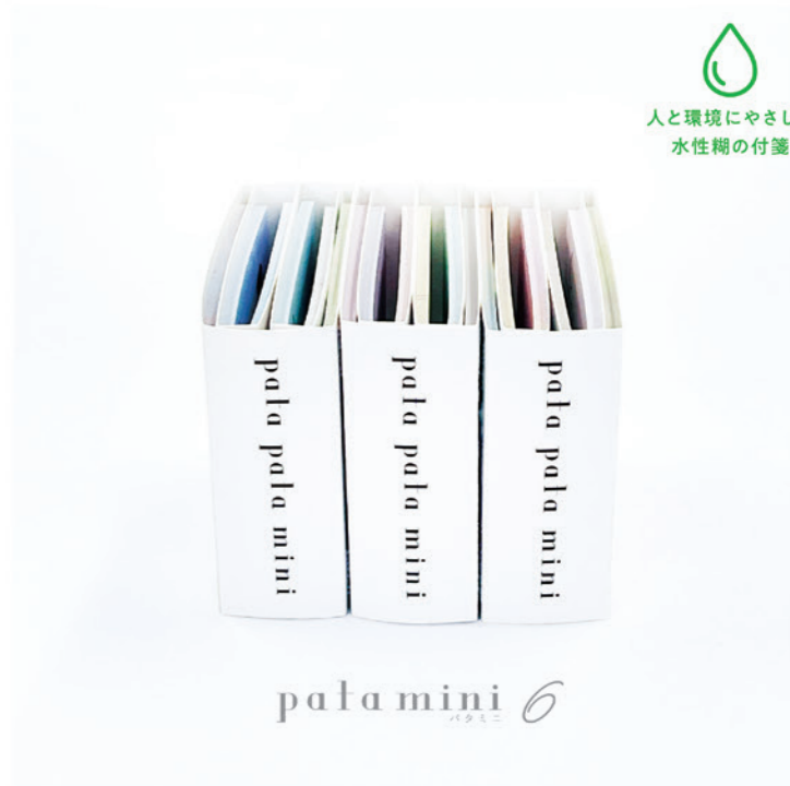
pata mini 6