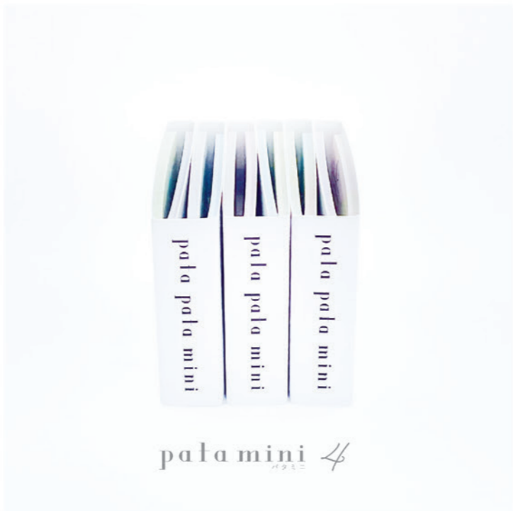
pata mini 4