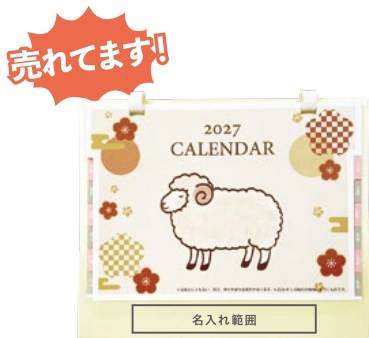
サイズ: W100 x H15 mm