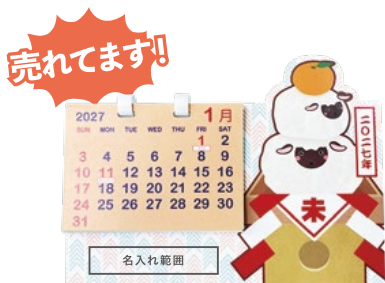
サイズ: W55 x H10 mm