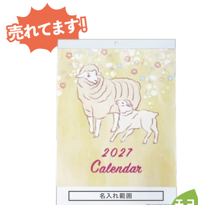
サイズ: W260 x H25 mm