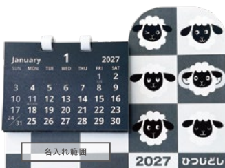
サイズ: W55 x H10 mm