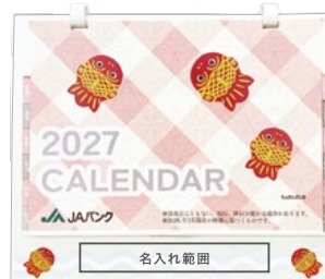
サイズ: W100 x H15 mm